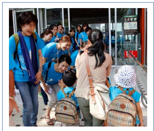
ボランティアスタッフがお出迎え