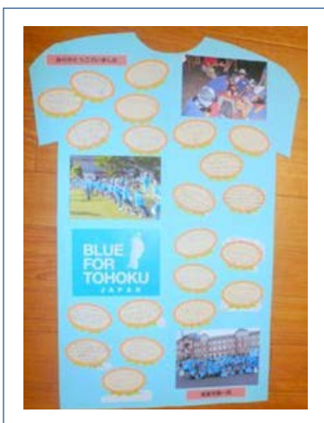
青葉学園から届いた感謝の寄せ書き

今回の「おいでよ！東京 2013」では、きめ細かいスケジュールを立てていただき、無事に参加させていただきました。子どもたち、一人一人にボランティアの方がついていただき、個別にじっくり関わっていただけたことは大変良かったです。特に、年少児については安心感がありました。また、新幹線・地下鉄の移動をさせていただいたことも良かったです。切符の買い方も、ボランティアの方と一緒に体験することができました。乗り物が好きな子どもは大喜びでした。今回のように、キッズニアで職業についての意識を早めに持つことも有意義なことだと思っております。スポーツ選手の身体能力に、子どもも私たち大人も大変驚きました。帰路にて疲れてしまう子どももおりましたが、人の多いキッズニアで遊んだ後、広い場所で体を動かさせたのは良かったと思います。