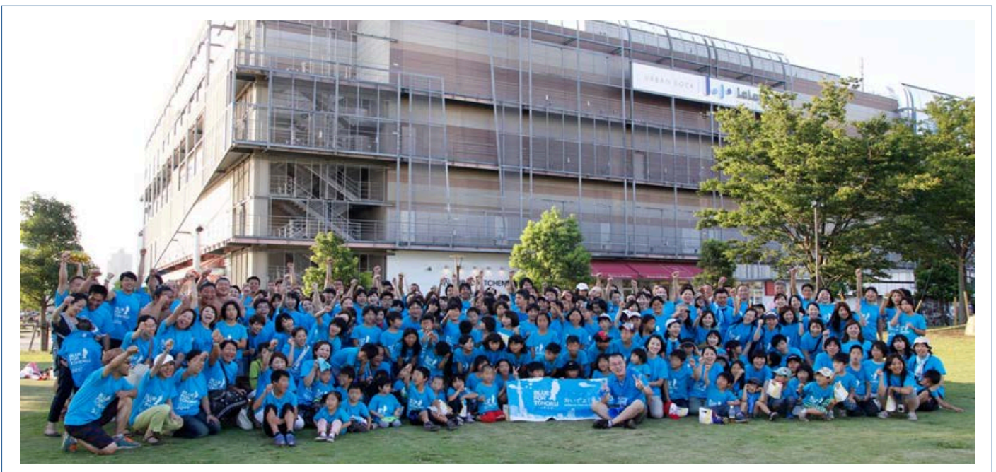
最後にみんなで記念撮影！