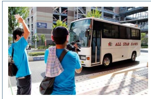
子どもたちを乗せたバスが到着！

「実はこれは、子どもたちにとって何よりうれしいこと」と、施設職員の方。「施設では、どうしても一人の子どもに一人の大人が付きっきりになることはできません。自己主張が強い子、問題を起こす子が優先されがちで、大人しい子や内気な子は、なかなか大人に意志を伝えることができないのです。今回のように、丸一日、一人の大人が自分のために時間を費やしてくれるのは、子どもにとって素晴らしい思い出になります」とお話ししてくださいました。