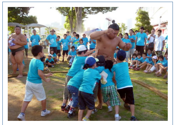
みんなで力を合わせて、押し出した！