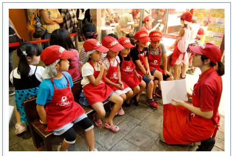
キッズニア内での子供たちの様子。 皆、思い思いの仕事にチャレンジしました！