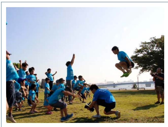
どうやったらあんなに高く飛べるのかな？

その後は、施設同士での交流会を実施しました。同じ県内にあっても、お互いの施設について知らないこともたくさんあります。「夏祭りはあるの？」「お休みは何をしているの？」と、お互いに質問をし合い交流を深めました。