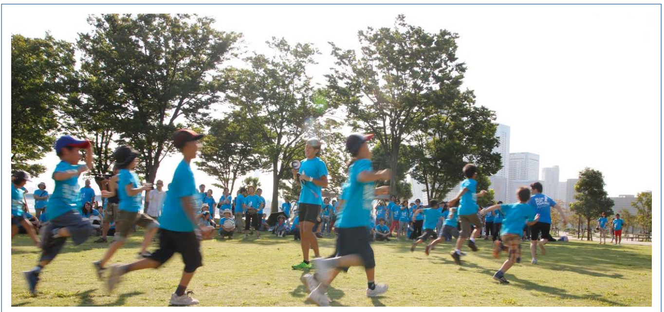
青空の下を駆け抜けて